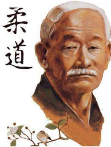
Jigoro Kano grondlegger van het Judo

is ontstaan uit de andere Japanse vechtsport Jiu-jitsu. De Japanner Jigoro Kano, geboren in 1860 deed Jiu-jitsu.